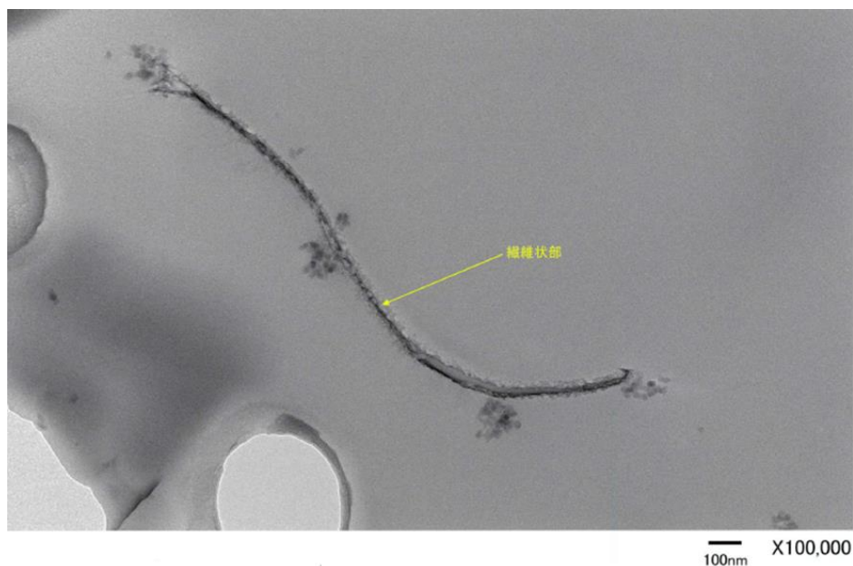
図 2 .エポキシ樹脂中で観察された CNF

この CNF は、CFRP を作成する際に樹脂と共に炭素繊維の隙間に入り込んで存在し、ネットワークを形成することで、外力からの破壊進展を妨げる干渉材の役割を果たすものと推察されます。CFRP は炭素繊維とマトリックス樹脂との間に界面が存在するので、衝撃を受けた時に界面剥離 ※4 が破壊起点となります。今回利用した CNF がマトリックス樹脂内に均質に分散し、CNF に付与された官能基がエポキシ樹脂と炭素繊維の間の強度を高めることに貢献し、界面剥離を抑制していると考えられます。このことは CFRP 破壊後の走査型電子顕微鏡 (SEM) 観察により、炭素繊維表面上に付着する樹脂の様相にて、CNF 添加仕様のもので多く残存していることで確認できました。(図 3 参照)