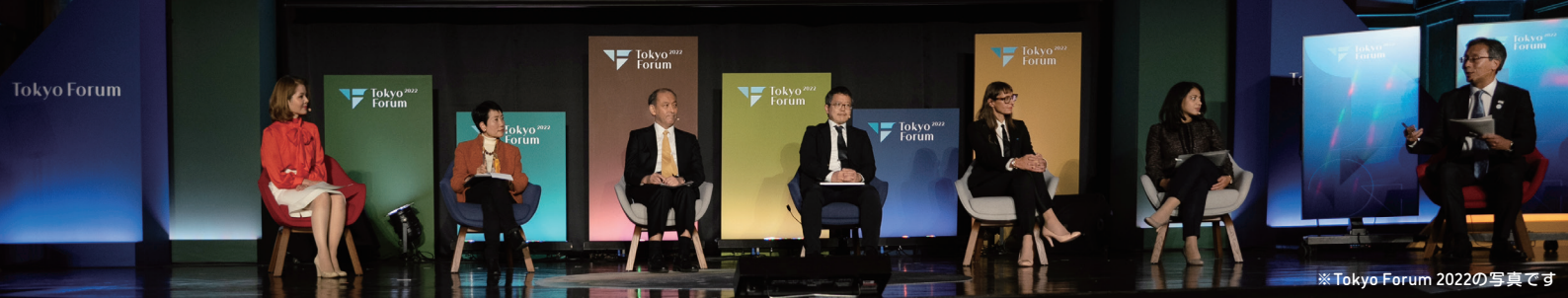
※Tokyo Forum 2022の写真です

今回の東京フォーラムでは、科学技術と人文社会科学の専門知識を結集し、社会的分断とデジタル革新が渦巻く中で人類は地球規模の課題とどう向き合っていくかを探求します。